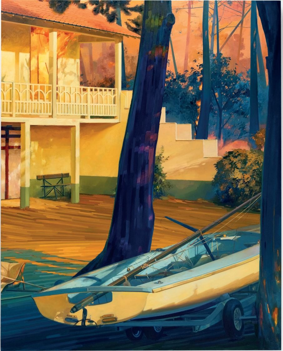
La vacance des grandes valeurs, 2023 huile sur toile, 160 x 120 cm