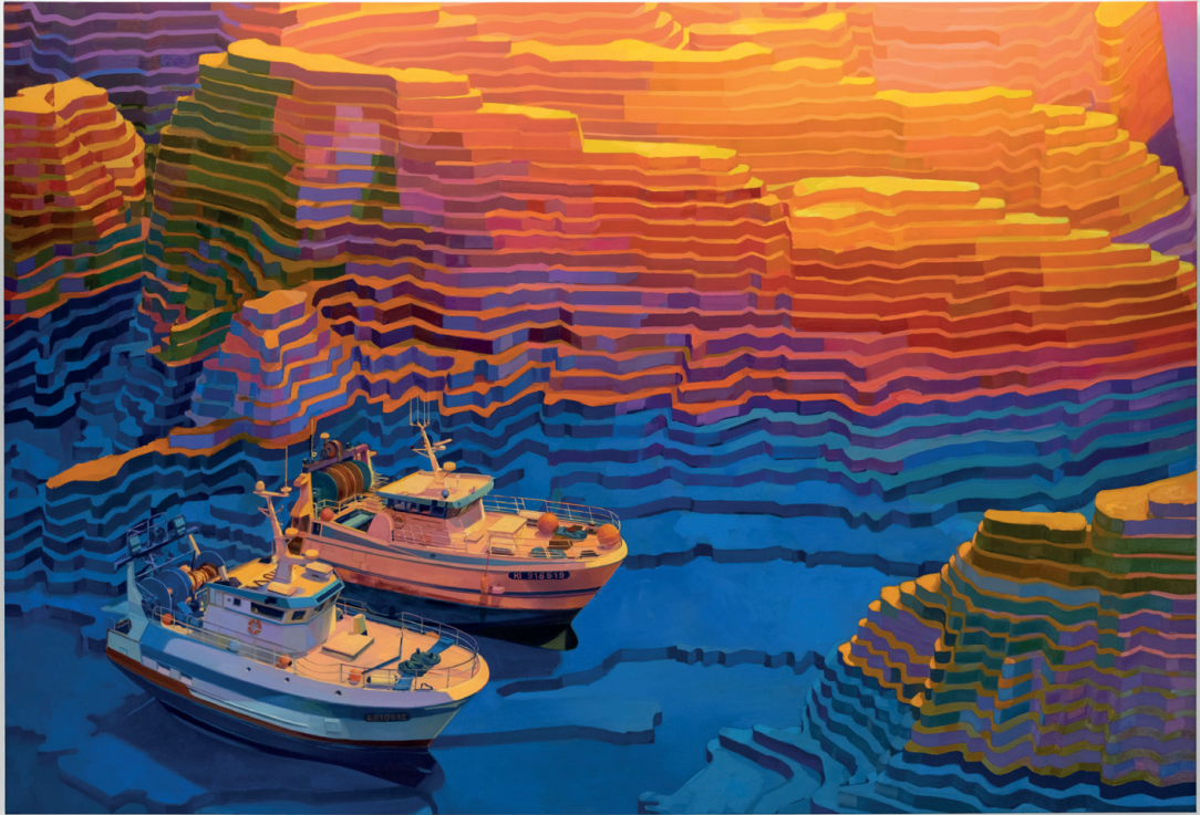
Paysage évaporé , 2023 huile sur toile, 150 x 220 cm