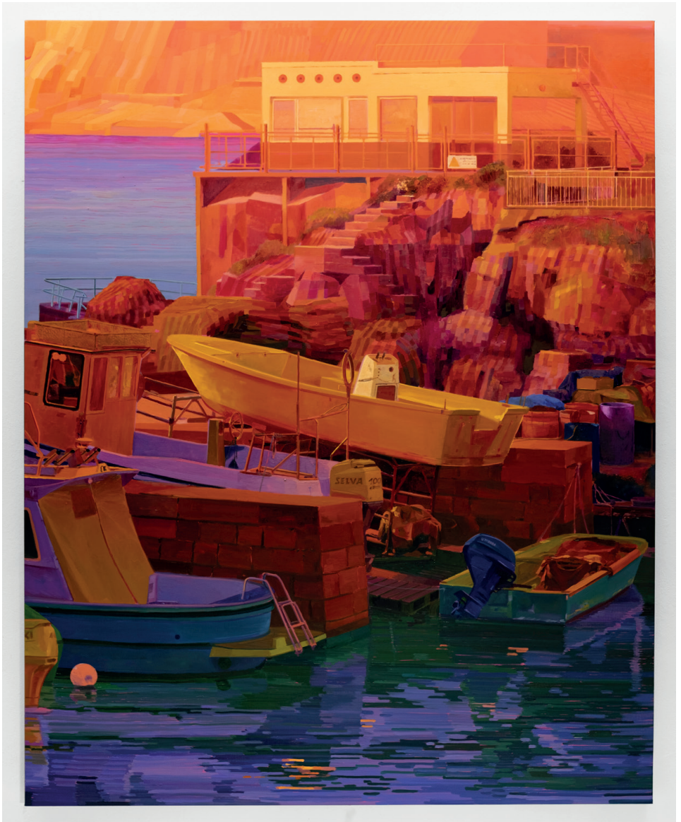
Mercury, 2023 huile sur toile, 150 x 120 cm